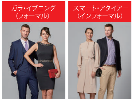
女性:イブニングドレス、カクテルドレス、着物など 男性:タキシード、ディナージャケット、ダークスーツにネクタイなど 女性:カクテルドレス、スタイリッシュなスーツ、ワンピースなど 男性:ジャケットの着用をおすすめします(ネクタイなしでも可)

※レストラン等では肌寒く感じることもございますので、羽織れる物をお持ち頂くことをおすすめいたします。