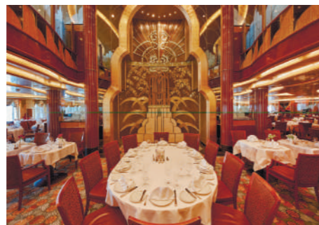
ブリタニア・レストラン