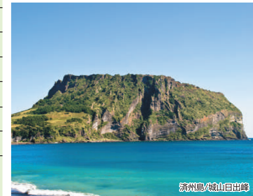
済州島/城山日出峰