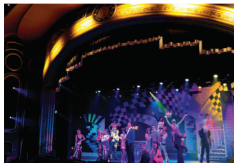
ロイヤル・コート・シアター

初めてご乗船される方も、何度もご乗船いただいているキュナードも、クイーン・エリザベスで唯一無二の体験をお楽しみください。