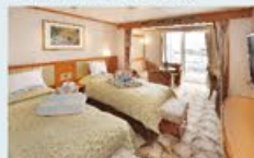
ジュニアスイート 31㎡・2名1室利用