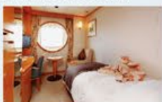
デラックスシングル 13㎡・1名1室利用