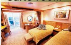
ビスタスイート 37㎡-42㎡・2名1室利用