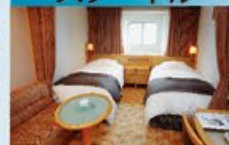
スーペリアツイン 14~18㎡・2~3名1室利用