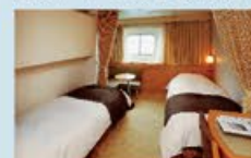
コンフォートステート 14㎡・2~3名1室利用