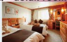
デラックスツイン 19㎡・2名1室利用