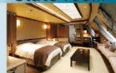
スーペリアコンセプトルーム 42㎡・4~5名1室利用