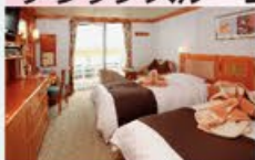
デラックスペランダ 24㎡・2名1室利用