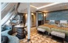
オーシャンビュースイート 33㎡・2名1室利用