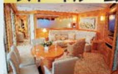
グランドスイート 79㎡・2名1室利用