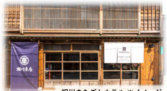
相川まちごとホテル ※イメージ