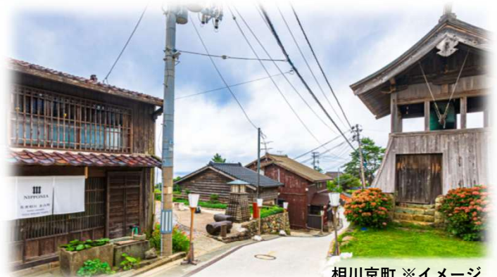
相川京町 ※イメージ