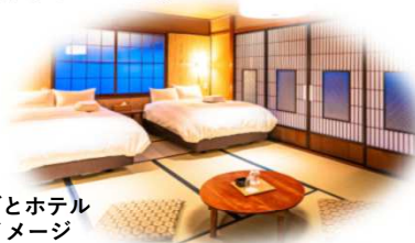
相川まちごとホテル 客室 ※イメージ